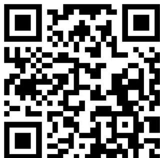
山东省大学生就业服务平台网址二维码

(网址: https://caiji.gxjy.sdei.edu.cn/caiji/login ), 对录入的生源信息数据进行初审。登录账号为毕业生辅导员/班主任 姓名首字母大写缩写+手机号 , 登录密码为毕业生辅导员/班主任 姓名首字母大写缩写+@+手机号 。(例如: 辅导员张三, 手机号: 123456, 账号: ZS123456, 密码: ZS@123456)